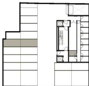
GARAGEM + ARRUMOS (PISO -2)