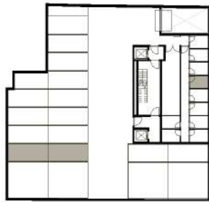
GARAGEM + ARRUMOS (PISO -2)